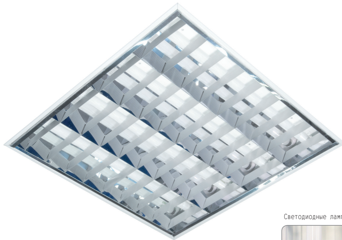
Светодиодные лампы T8 G13

Предназначены для общего освещения общественных и иных помещений. В светильниках используются ретрофитные светодиодные лампы в форм-факторе T8 G13.